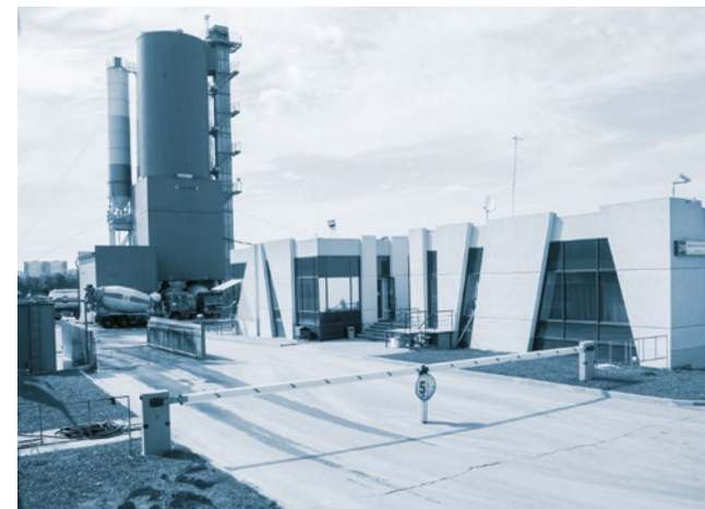
Бетонный завод 223